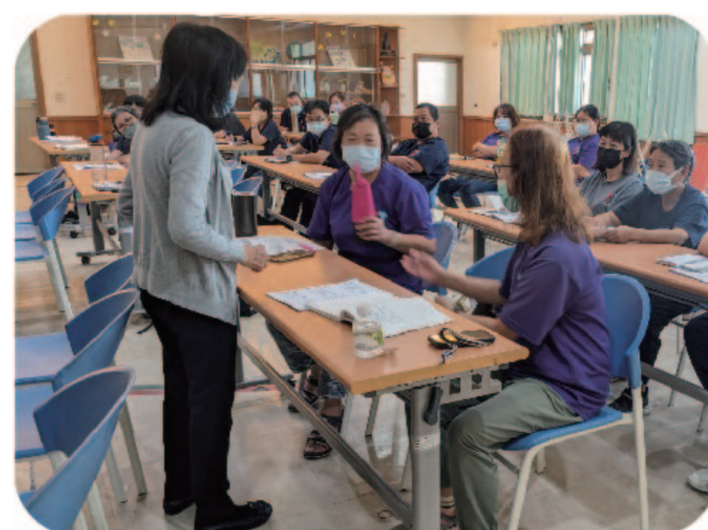
▲心智障礙者的性別教育與支持服務