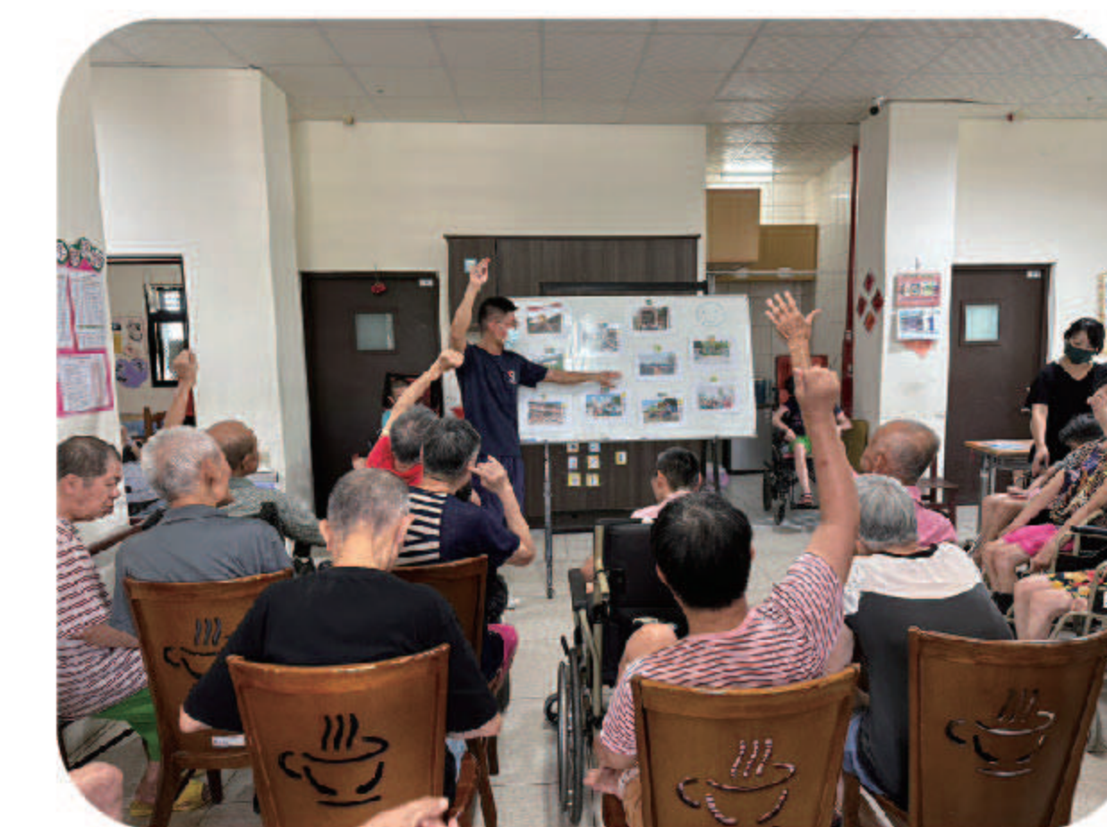
▲召開112年第三季服務對象自主會議