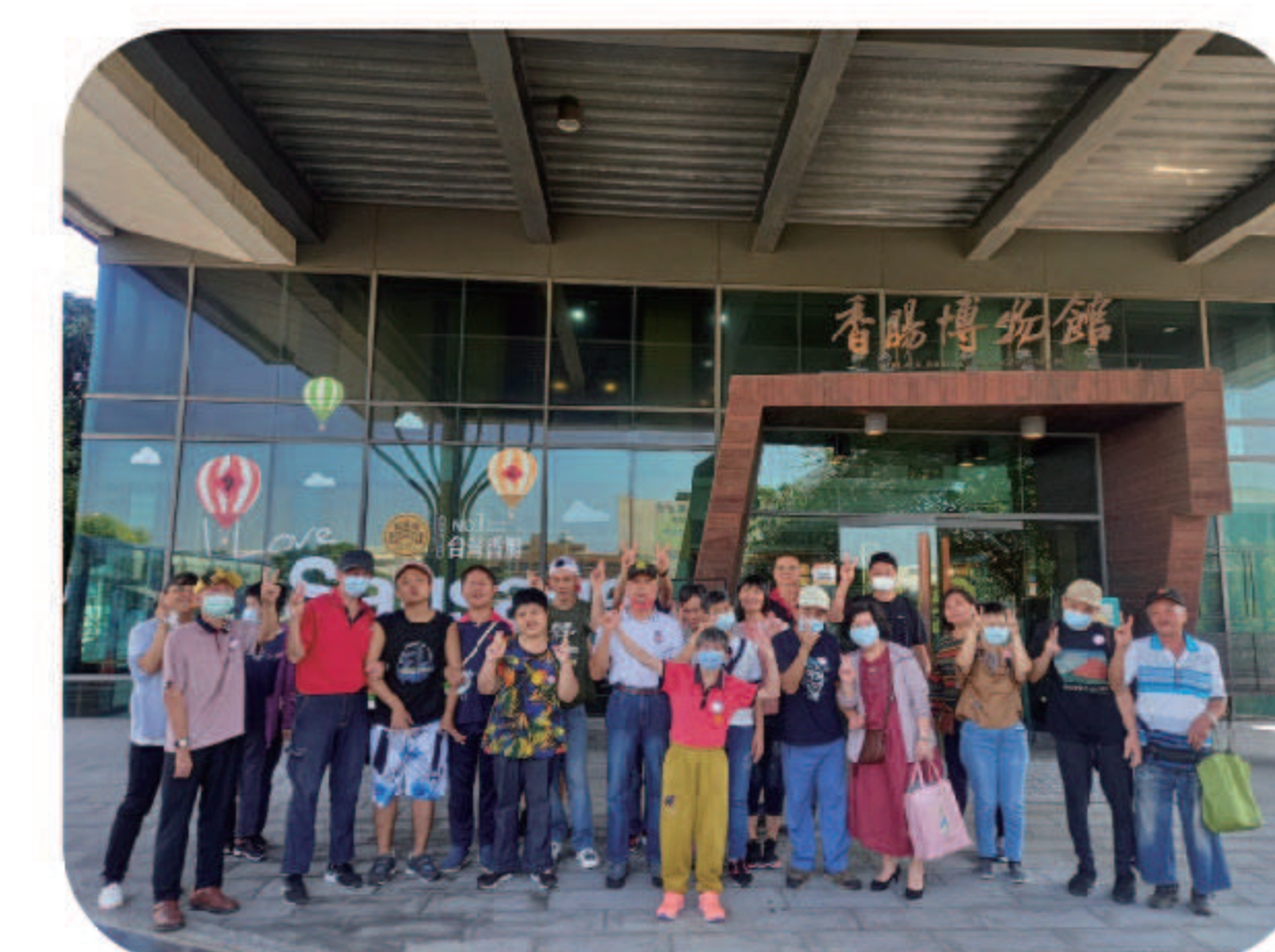
▲香腸博物館親子遊