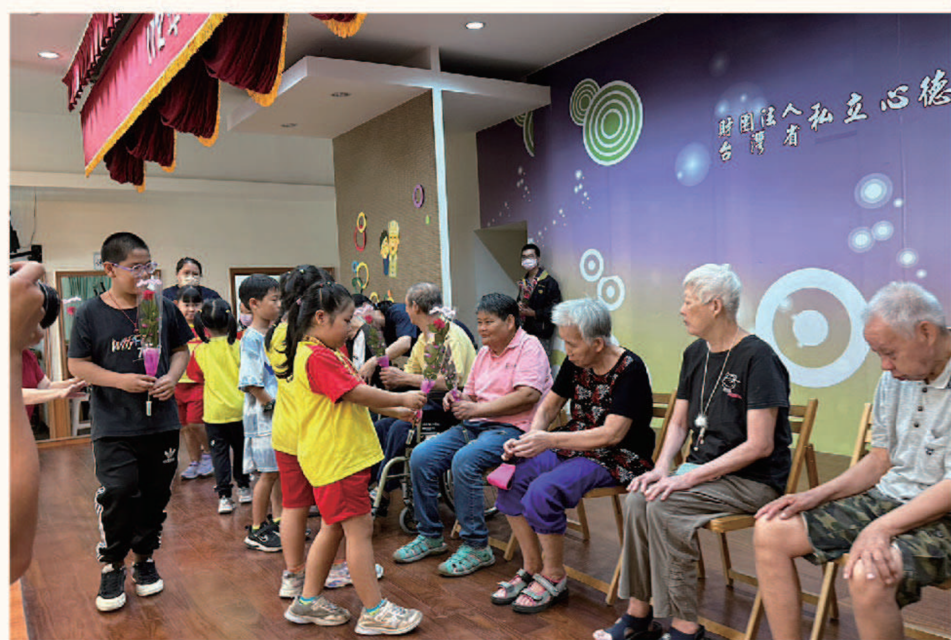
▲感恩儀式 | 透過獻花傳遞敬老溫情

活動當天先由本院舞蹈班帶來開場舞為活動拉開序幕，接著新橋國小也帶來烏克蘭及大會舞表演，精彩的演出也讓大家感受到學生滿滿的活力，大家平時較少看到烏克蘭，目光都被樂器和小朋友們的歌聲所吸引，自彈自唱讓台下的長輩看得目不轉睛；另一組小朋友則是拿起彩球跳起大會舞，搭配輕鬆愉快的音樂，瞬間活絡了現場氣氛。除了看表演外我們也邀請台下的長輩一起進行簡易的手指健身操，希望長輩們每天保持愉快的心情之外也要擁有健康的身體。