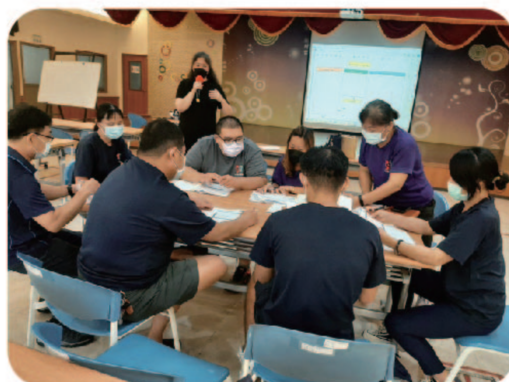
▲心智障礙者情緒行為與正向行為支持模式