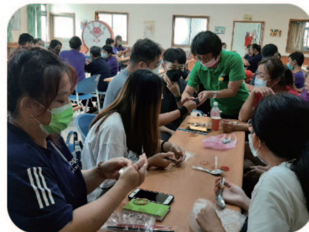
▲輔具再復能與自立生活訓練