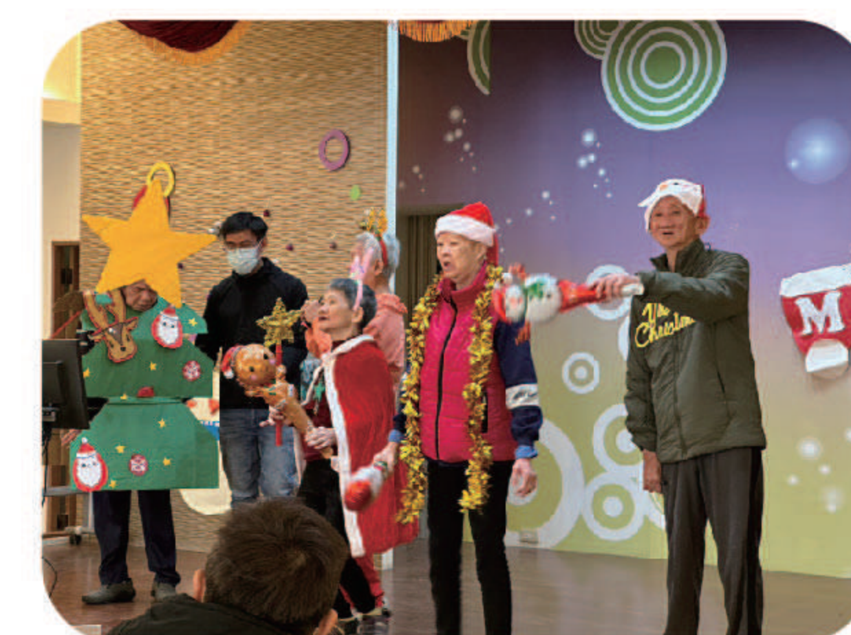
▲『溫馨聖誕同歡會』聖誕節活動