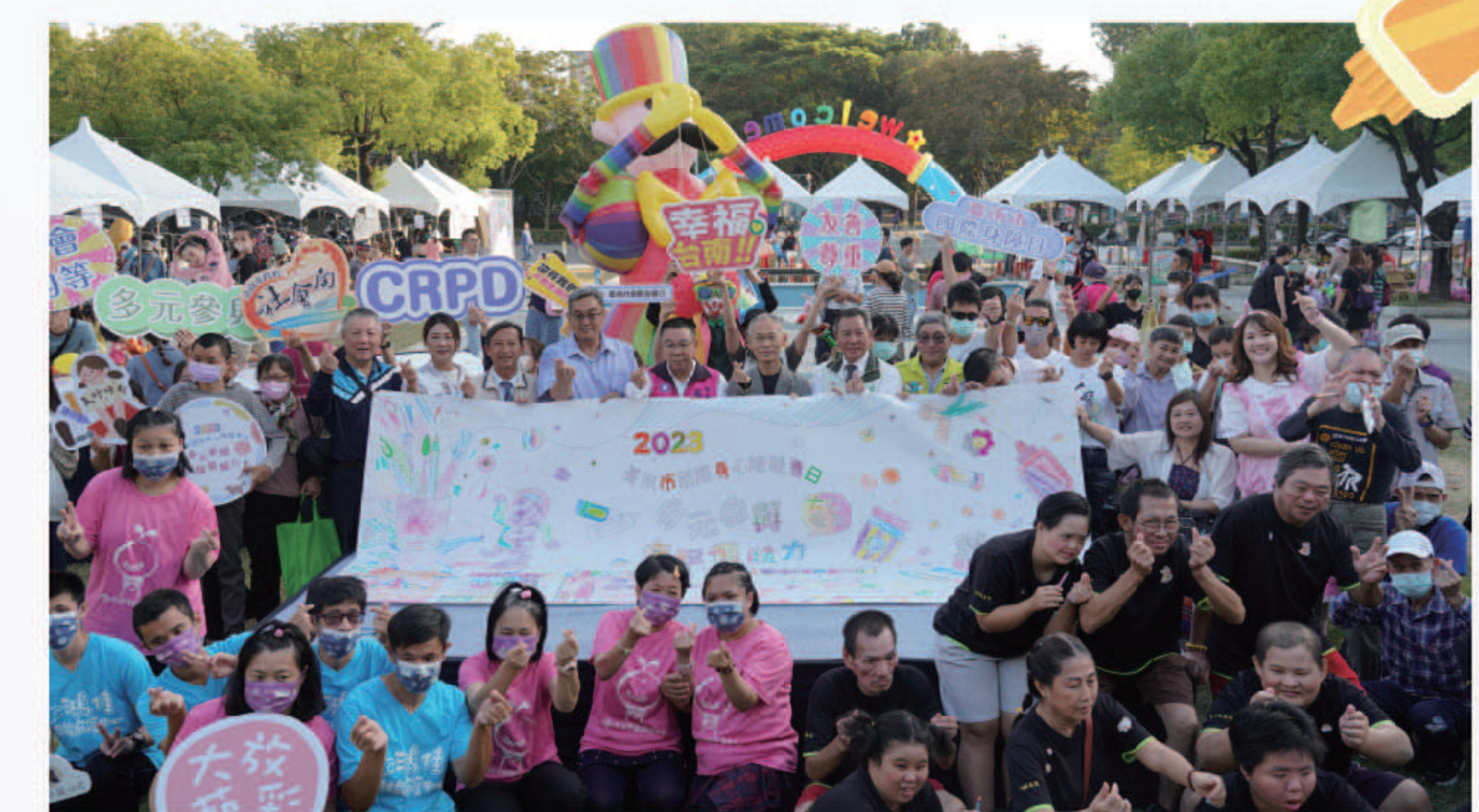
▲焦點儀式 | 大家不分你我共同創作