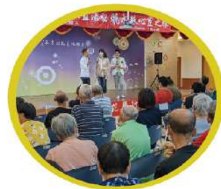
▲ 曉水珠心靈之旅到院義演