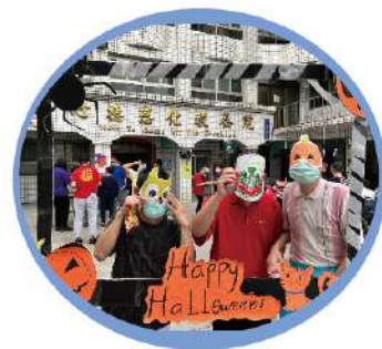
▲ 「搞怪不怪」萬聖節活動