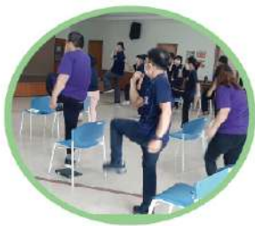
▲「中高齡體適能活動設計」課程